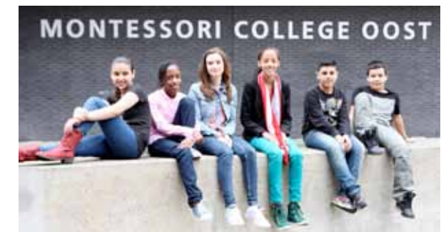
Montessori ISK Amsterdam